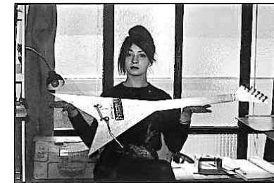
Catherine Ringer des Rita Mitsouko